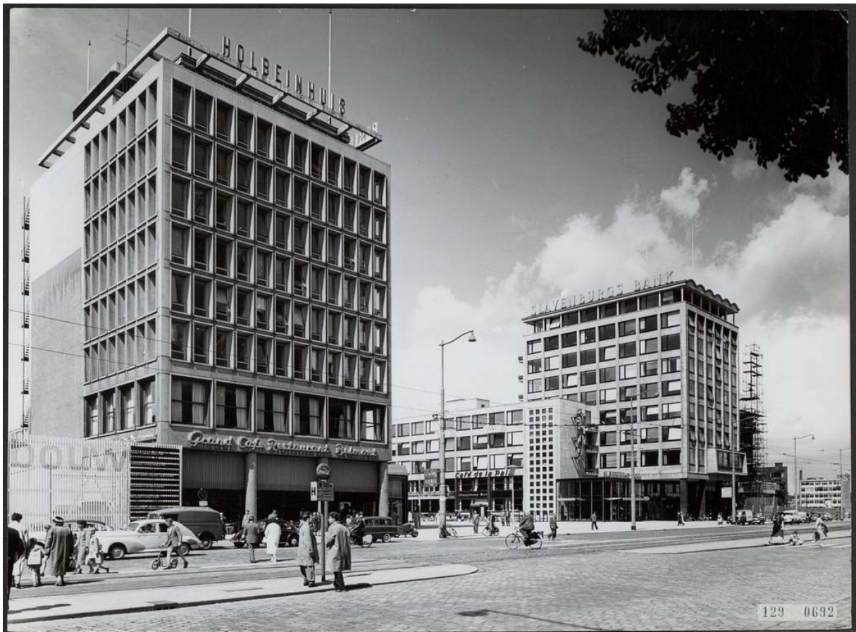
fig (1) Koester de gebouwde brute waarheden uit het verleden