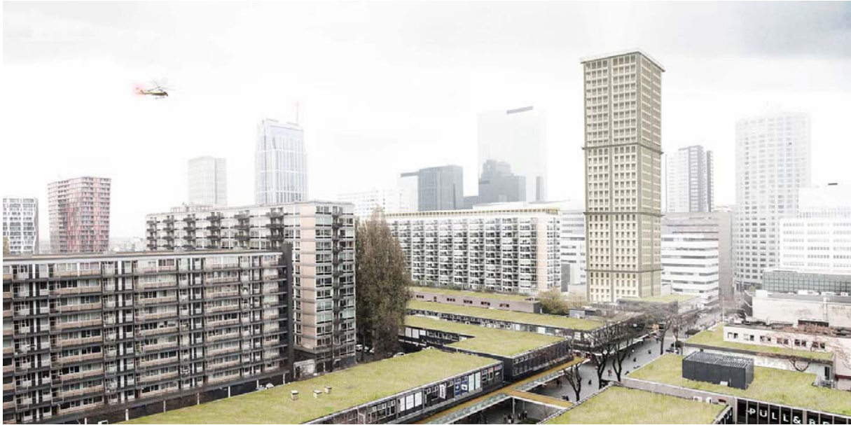
fig (2) Stimuleer de nieuw te bouwen waarheden van de toekomst